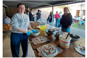
Semaine sans écrans : soirée tournois sportifs et danse, jeux de société et tartes flambées confectionnées par les lycéens.