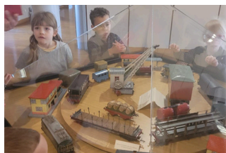
Visite du musée la Nef des jouets à Soultz. Dans le thème de l'année « le souvenir » : les jouets d'autrefois.