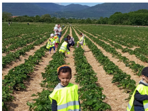
Cueillette de fraises pour les petites sections à Soultz.