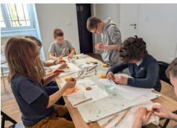
Atelier poterie pour les CM1 au musée Théodore Deck de Guebwiller.