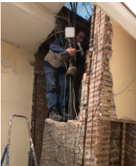
Démolition d'une cheminée pour créer une salle de bain pour des locataires du 3ème étage.