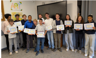
Diplômés du concours de maths "Kangourou".