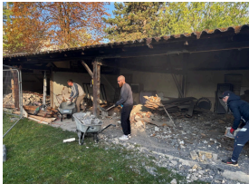
Travaux dans les chalets de l'église évangélique afin de les transformer en salles de classe.