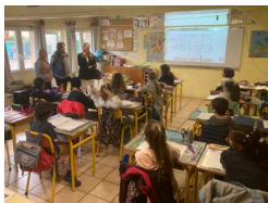
Trois visiteuses de Lituanie répondent aux nombreuses questions des CM2 !