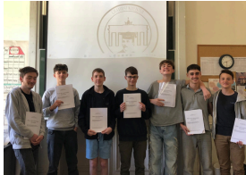
Félicitations aux lauréats du championnat de grammaire allemande en 3ème !