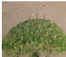
Quelques productions de land-art des CM1.