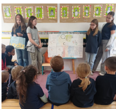
Les collégiens présentent leur exposé de S.V.T. aux maternelles.