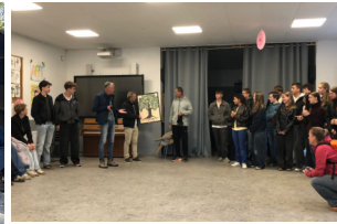
Venue des élèves du Pays-Bas. Ils nous ont offert un cadeau fait main pour les 40ans de l'établissement.