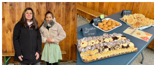
Le marché de Noël organisé par la maternelle