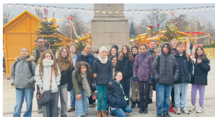
Sortie des 5èmes à Colmar