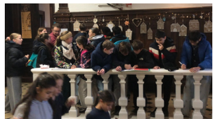
Les défis du calendrier de l'Avent proposés par les enseignants. Bravo aux élèves pour leur participation !