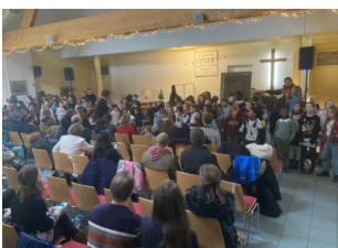
Fête de Noël de l'école primaire

Les élèves ont chanté des chants de Noël, joué du violon et du xylophone et donné des cartes de Noël à la maison de retraite les Capucines de Soultz. Les résidents étaient très contents de passer ce temps avec les enfants ! Ils ont même chanté avec eux et profité tous ensemble d'un bon goûter avec des biscuits de Noël, des jus de fruits et des chocolats. Mme Philippe, enseignante de C.M.1