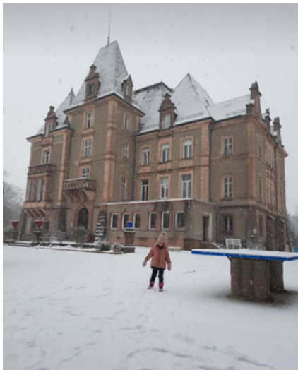
Premiers flocons de neige