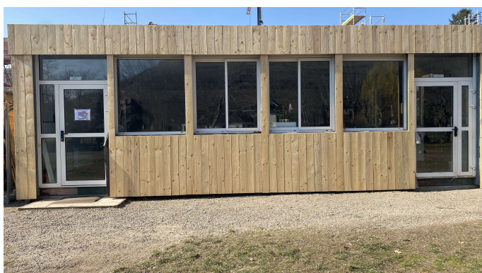
Bardage bois du préfabriqué terminé !